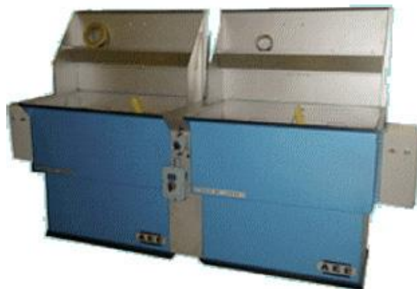
Dégraissage avec brosse