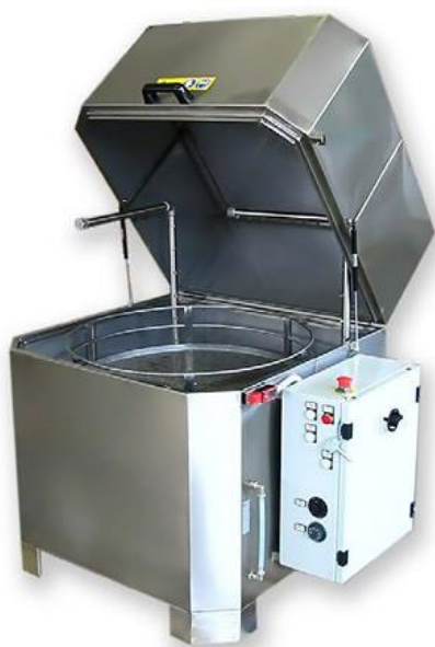
Fontaines à solvants