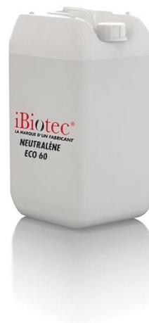
Bidon 20 L