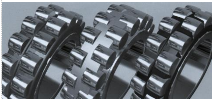
Dégraissage de composants mécaniques

Élimination d'encre fraîche en impression flexo et héli.